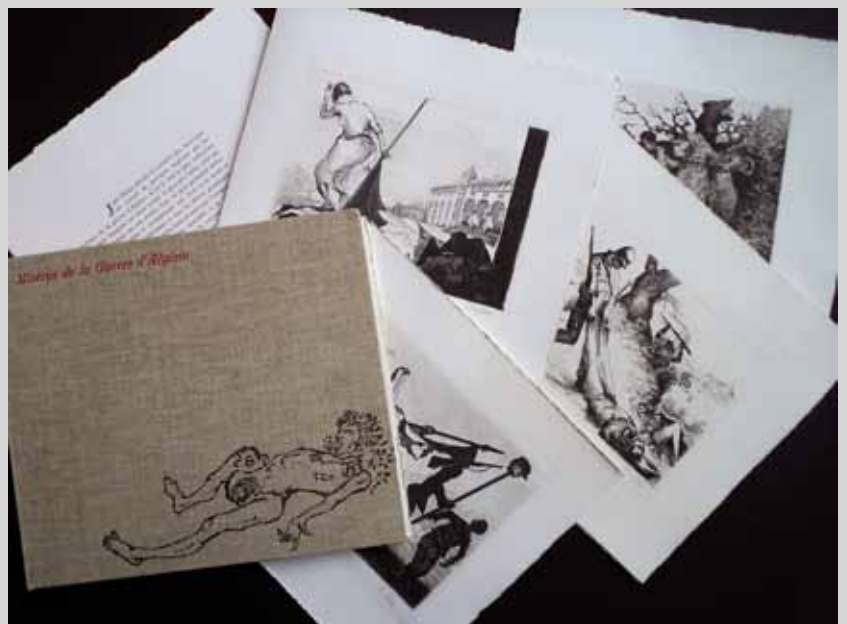
Jean BRUNE Misères de la guerre d'Algérie Recueil agrémenté de 20 eaux-fortes de Jean-François GALEA (né en 1944). Tirage limité à 3 exemplaires. 600 / 800 €