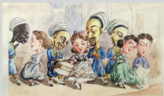
C. AMELOT Aquarelles caricatures figurant des Turcos à Paris, vers 1855 200 / 300 €