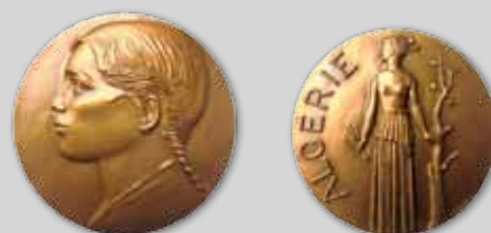
Paul BELMONDO Algérie Médailles en bronze de 1959. Poids : 250 gr 100 / 150 €