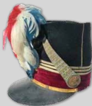
Shako de médecin 1850 Haut. : 27 cm 150 / 200 €