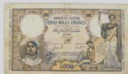
Billet 5.000 F Banque d'Algérie, 1942 300 / 400 €