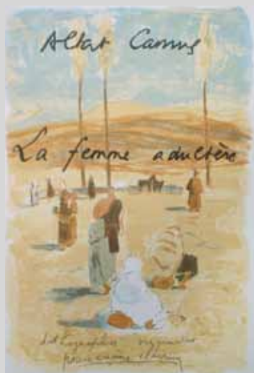
Albert CAMUS La femme adultère Alger, Noël Schumann, 1954 600 / 800 €