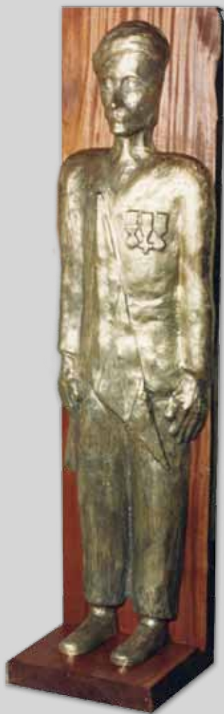
Marguerite LERIBOT de FOUCAUCOURT Hommage aux harkis, 1994 Épreuve en bronze, tirage unique. Haut. : 190 cm 10 000 / 12 000 €