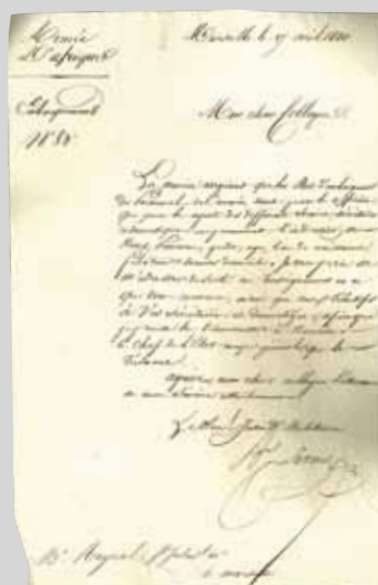
Conquête de l'Algérie 1830 Lot de 32 documents avec lettres et états comptables sur les aspects médicaux de l'expédition d'Alger. 4 000 / 5 000 €