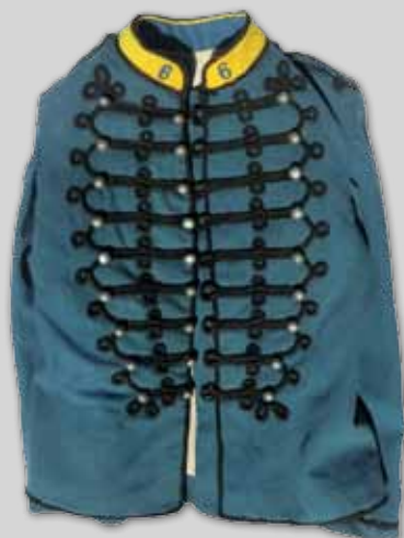
Dolman du 6 ème Régiment de Chasseur d'Afrique 200 / 300 €