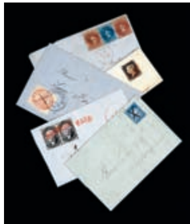
Lots 66, 77, 91, 100 et 101