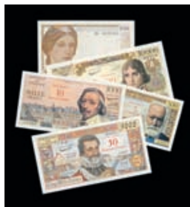
Lots 109, 113 à 117