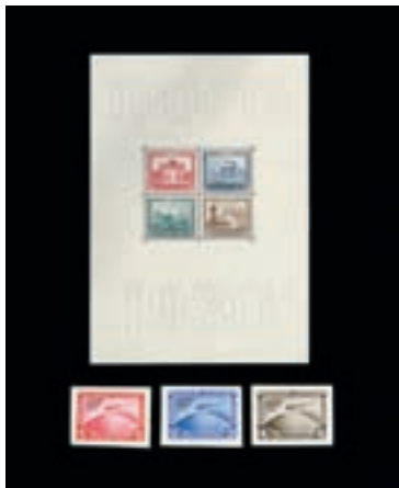
Lots 72 et 73