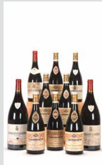
UN ENSEMBLE ARMAND ROUSSEAU de Chambertin et Chambertin Clos de Beze (ADJUGÉ 91 000€)