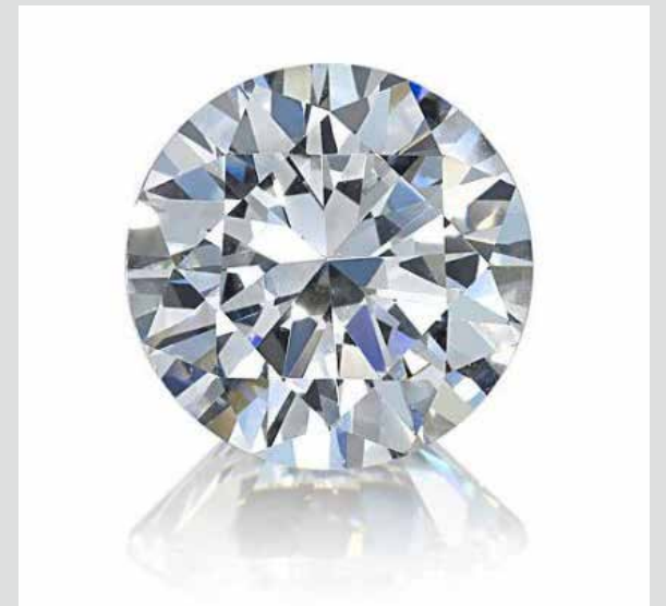
BAGUE EN OR GRIFFÉE d'un diamant taille ancienne de 2,68 carats couleur H, Pureté SI2 (ADJUGÉE 9 500€)