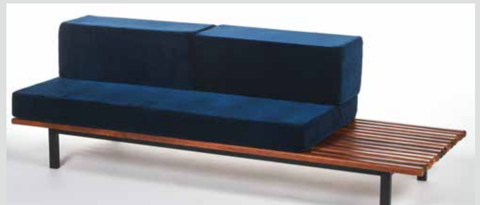
CHARLOTTE PERRIAND (1903-1999) Banquette à lattes en acajou, garniture en velours bleu nuit. (ADJUGÉ 7 500€)