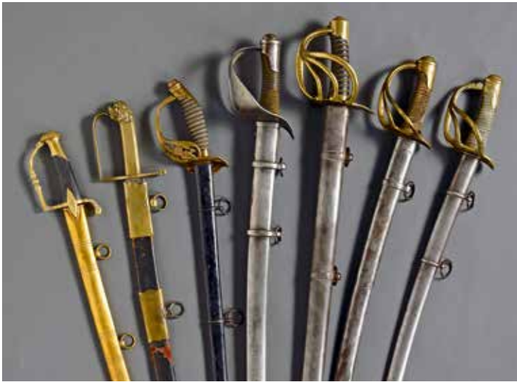
FRANCE et divers : D'un ensemble de sabres, XVIII e -XX e siècles