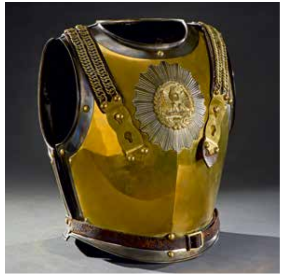
FRANCE : Cuirasse de carabinier troupe, modèle 1825, Second Empire