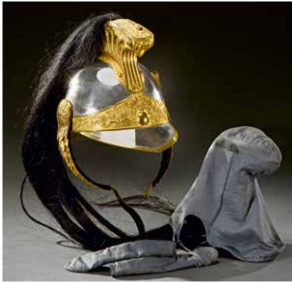
FRANCE : Casque d'Officier de Dragon, modèle 1874 (avec sa housse)