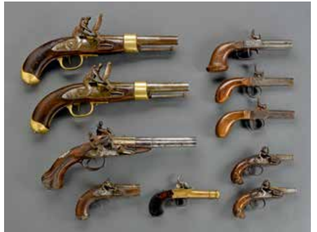
FRANCE, pistolets XVIII e -XIX e siècles