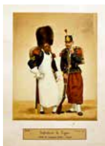
« Album photographique des uniformes de l'armée française » par L. Laffont et A. Godillot