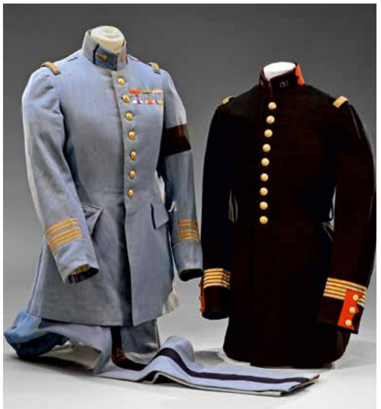
FRANCE : Série d'uniformes ayant appartenu au Général de brigade Thierry-d'Argenlieu