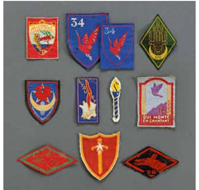
FRANCE D'un fort ensemble d'insignes Chantiers de Jeunesse