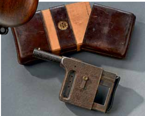
FRANCE Pistolet Gaulets numéro 3, calibre 8 mm