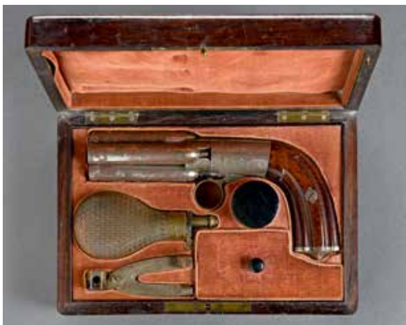
FRANCE : Coffret nécessaire pour pistolet poivrière