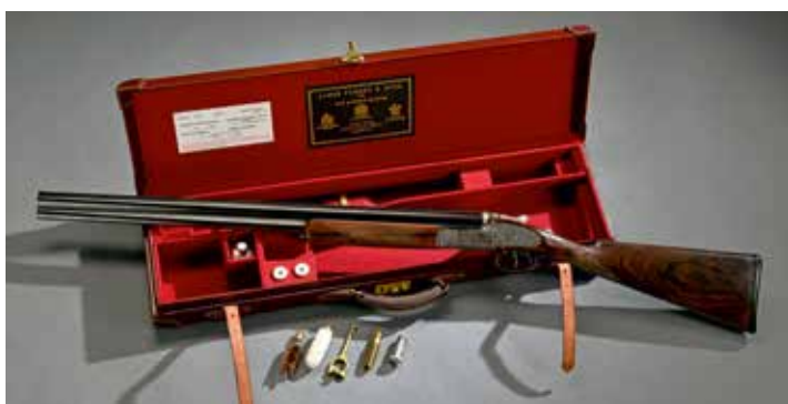
ANGLETERRE : Fusil de chasse superposé PURDEY