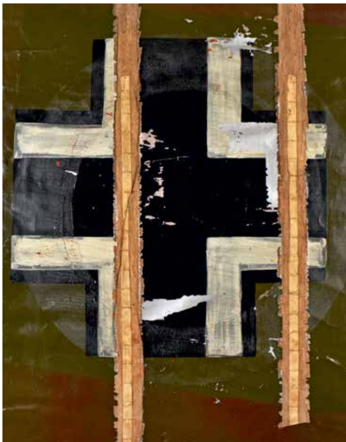
ALLEMAGNE : Entoilage d'avion 1939-45