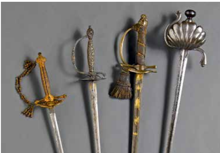
FRANCE et divers : D'un ensemble d'épées, XVII e -XX e siècles