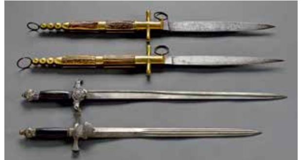
Dagues de l'École Impériale Forestière et divers