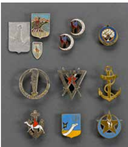
FRANCE D'un important lot d'insignes régimentaires