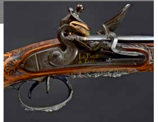
FRANCE, XVIII e -XIX e siècles