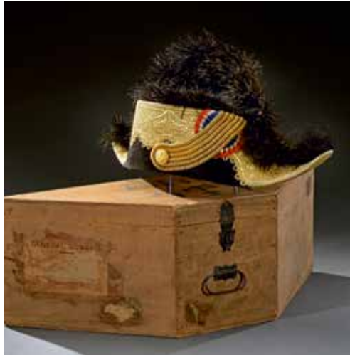
FRANCE : Bicorne de général de brigade, modèle 1872