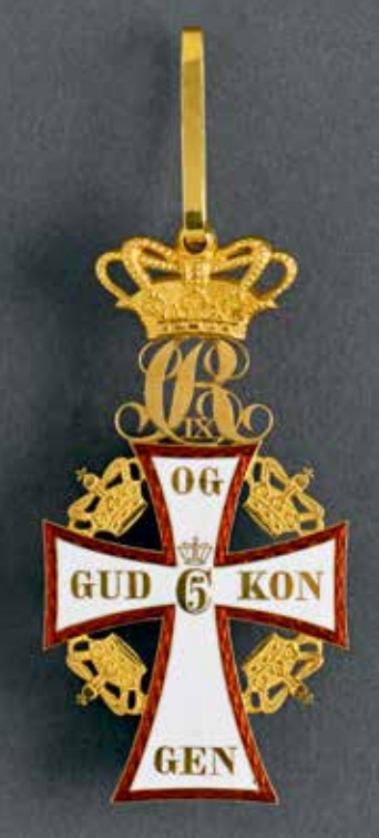
DANEMARK Croix de Commandeur du Dannebrog