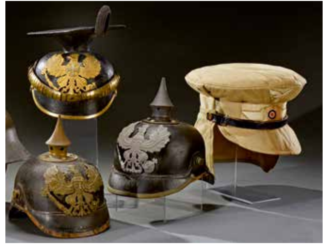
ALLEMAGNE : D'un ensemble de casques et coiffures