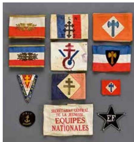
FRANCE : D'un ensemble de brassards Résistance et politiques