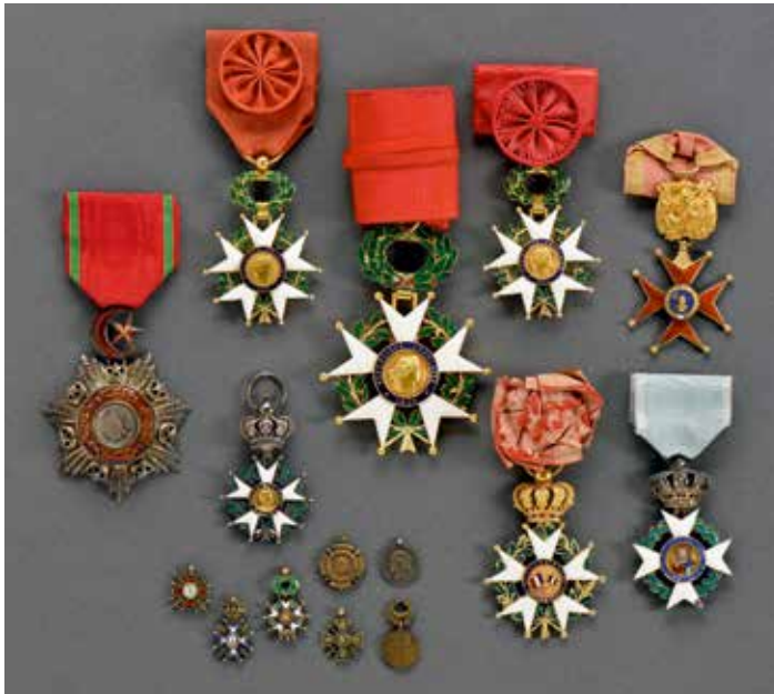
D'un ensemble de décorations (France, Japon, Turquie, etc.)