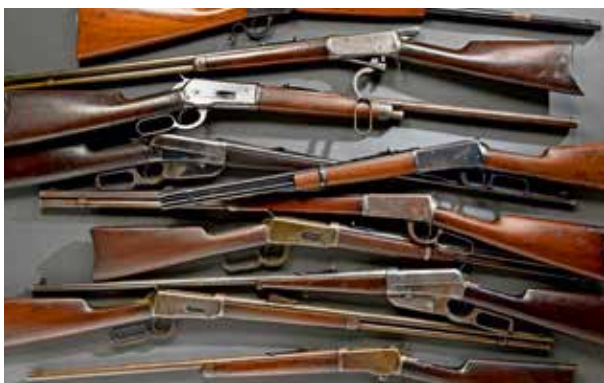
ÉTATS-UNIS : D'un ensemble de WINCHESTER