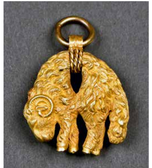
ESPAGNE ou AUTRICHE Toison d'or en pendentif (or jaune 18k) Poids : 26 g