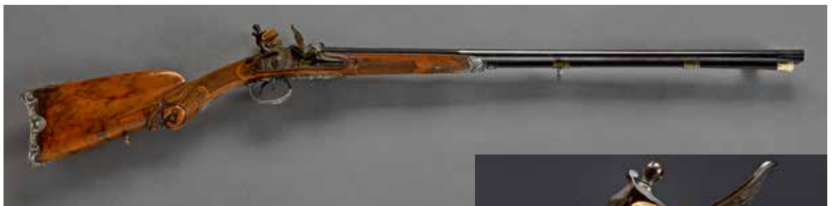
Fusil de chasse à silex « LE PAGE A PARIS » Début du XIX e siècle