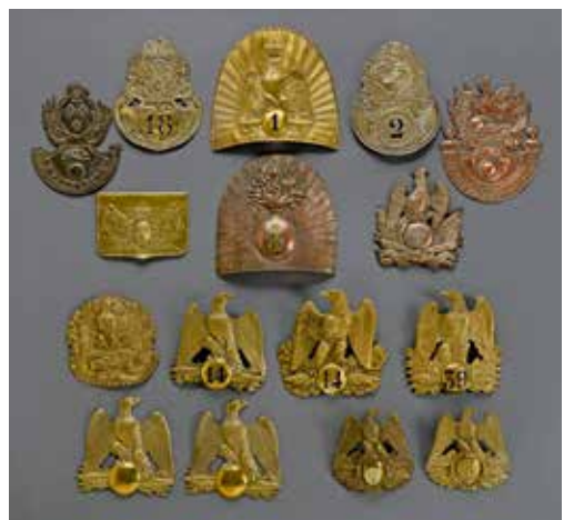
FRANCE D'un ensemble de cuivrieres du XIX e siècle