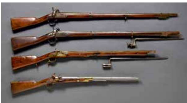
FRANCE ET DIVERS : D'un ensemble de fusils