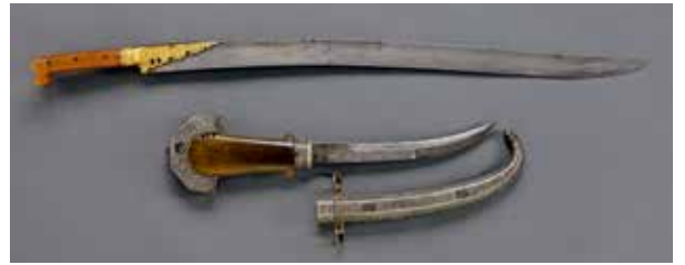
CAUCASE et AFRIQUE du NORD, XIX e siècle