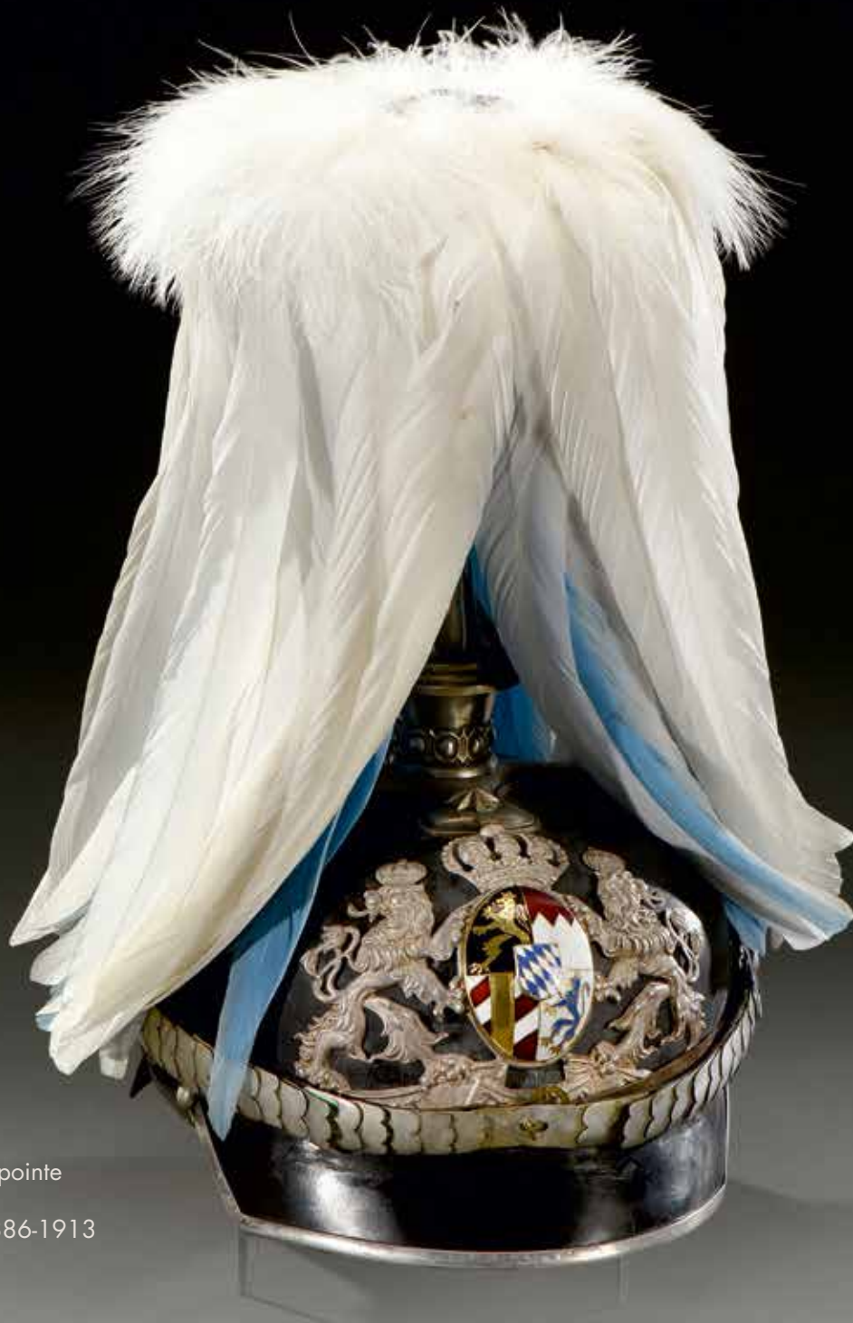
BAVIÈRE Casque à pointe de général modèle 1886-1913

LYON – JEUDI 26 AVRIL 2018 À 14 H 30 INSIGNES - DÉCORATIONS - SOUVENIRS HISTORIQUES - ARMES BLANCHES ET À FEU