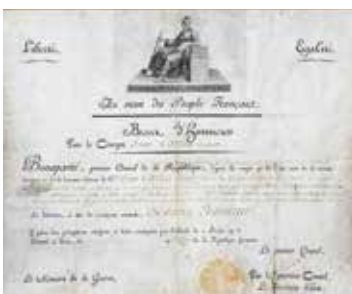
FRANCE : brevet pour un sabre d'Honneur (Arcole), Consulat