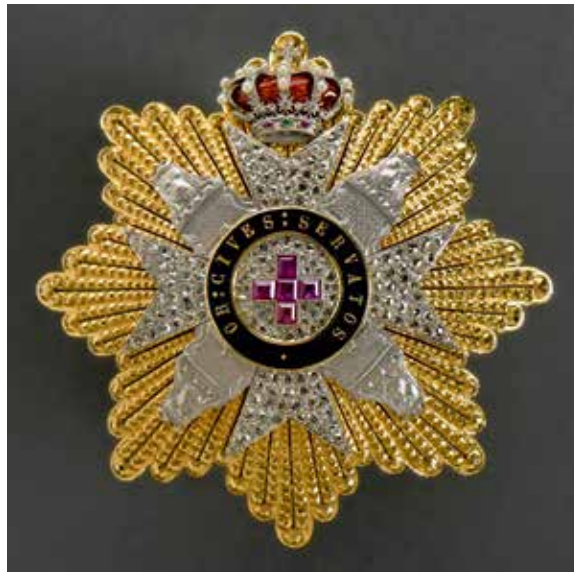
ESPAGNE : Grand-croix de la Croix-Rouge espagnole, 2 e type (or jaune 18k, platine, diamants et rubis)