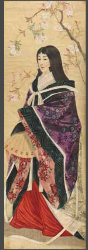
Époque MEIJI (1868 - 1912) Jeune femme sous les cerisiers en fleurs, encre sur soie, H. 129 cm