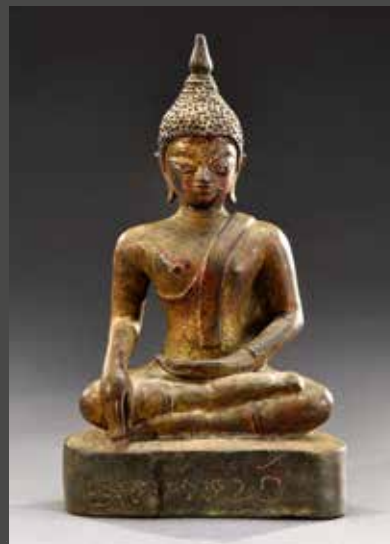
LAOS, XVII e siècle - Bouddha assis, bronze et nacre, H. 23 cm