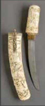
Époque MEIJI (1868 - 1912) - Tanto, L. 33,5 cm