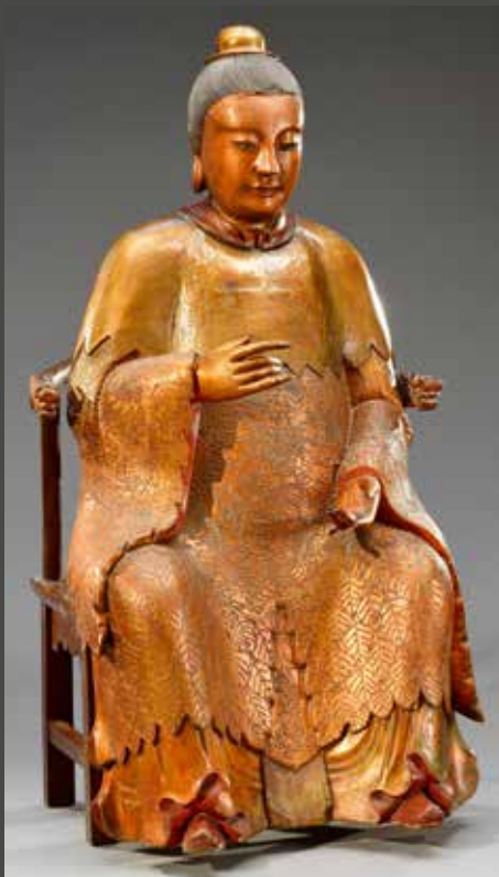
XVIII e siècle - Grande statue de dignitaire assis sur un trône, bois laqué et doré, H. 150 cm