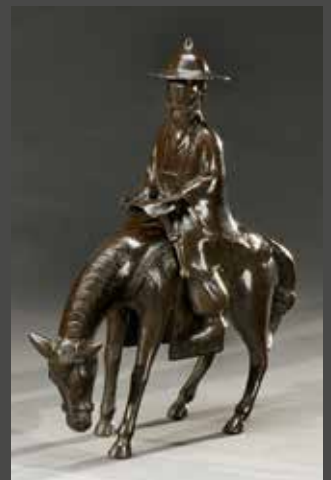
Époque MEIJI (1868 - 1912) Toba sur sa mule, bronze, H. 37 cm