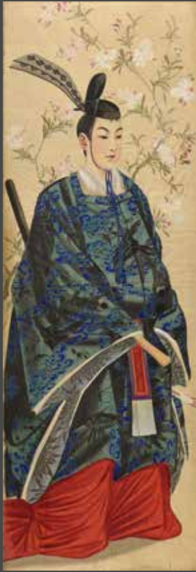
Époque MEIJI (1868 - 1912) Samouraï sous les cerisiers en fleurs, encre sur soie, H. 129 cm