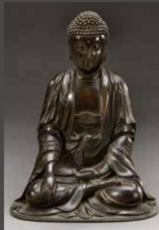
Époque MING (1368 - 1644) Bouddha en bronze, H. 22 cm