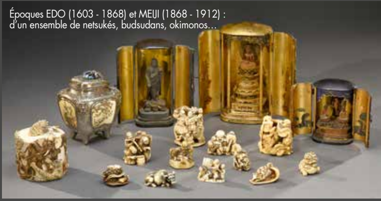
Époques EDO (1603 - 1868) et MEIJI (1868 - 1912) : d'un ensemble de netsukés, budsudans, okimonos...