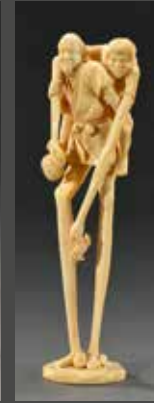
Époque MEIJI (1868 - 1912) - Ashinaga portant Tenaga, H. 23,5 cm