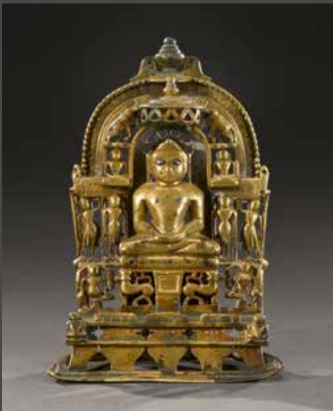
INDE, Jaïn, XVII e /XVIII e siècle Trithankara, H. 14,5 cm