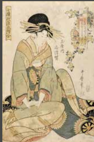
UTAMARO II (? - 1831) - Oban tate-e, H. 38 cm L. 25,5 cm