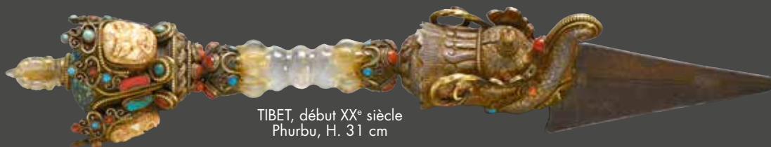
TIBET, début XX e siècle Phurba, H. 31 cm

RESPONSABLE DU DÉPARTEMENT Thibault DELESTRADE EXPERT Cabinet Portier & Associés - +33 (0)1 48 00 03 41 EXPOSITION Mercredi 7 mars de 14h à 18h - Jeudi 8 mars de 10h à 12h