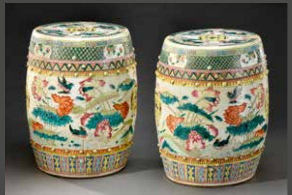
CANTON, fin XIX e siècle Paire de tabourets en porcelaine, H. 46 cm