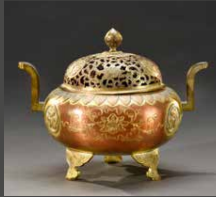
Époque EDO (1603 - 1868) Brûle-parfum tripode, cuivre, H. 16 cm