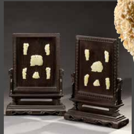
Début du XX e siècle - Écrans de table, H. 43 cm