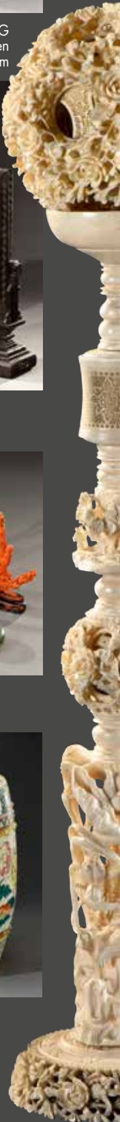
CANTON, début du XX e siècle - Importante boule de Canton et son support, H. 64 cm