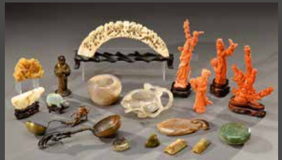
D'un ensemble d'objets d'ornement en bronze, néphrite, agate, cristal de roche, corail...