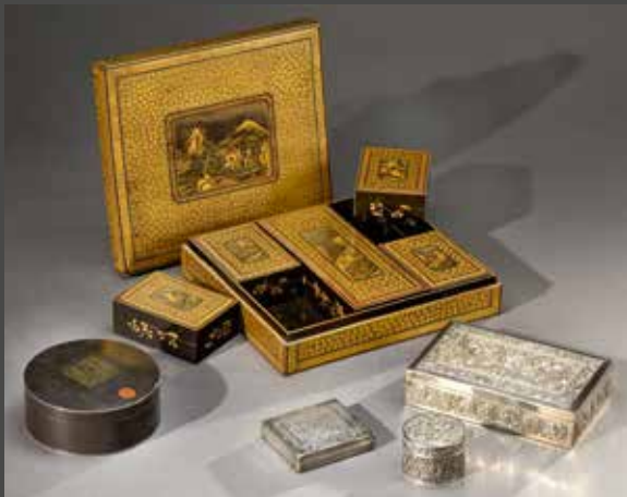
XIX e siècle - D'un ensemble de boîtes