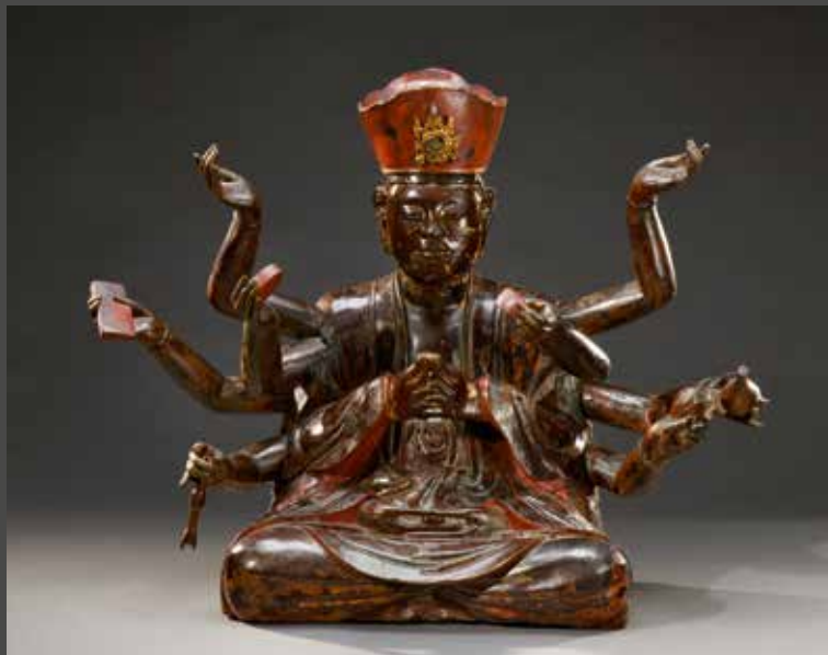
VIETNAM, XIX e siècle - Guanyin, H. 56 cm