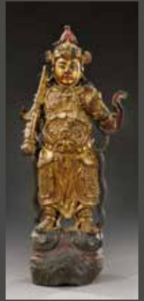
Époque MING (1368 - 1644) - Gardien debout, H. 42 cm