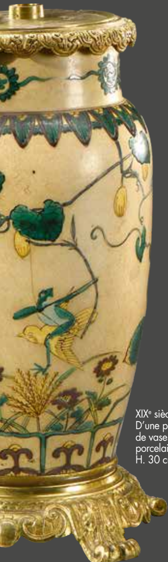
XIX e siècle D'une paire de vases en porcelaine, H. 30 cm