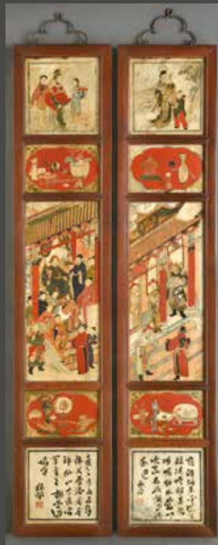
Époque MING (XVII e siècle) Suite de dix plaques d'albâtre, H. 120 cm