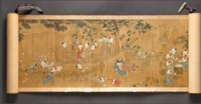
XIX e siècle - Les cent enfants, encre sur soie, H. 29,5 cm L. 310 cm