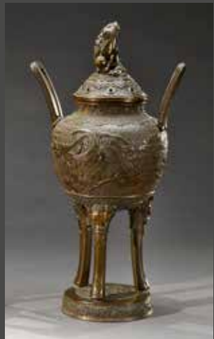
Époque MEIJI (1868 - 1912) Brûle-parfum en bronze H. 55 cm