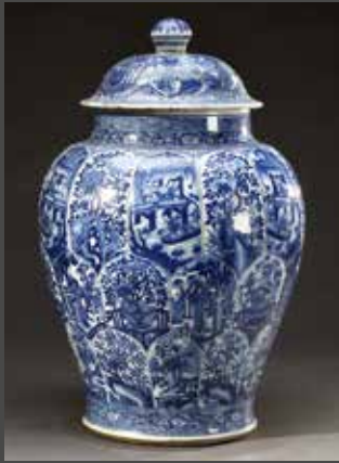
Époque KANGXI (1662 - 1722) Grande potiche, H. 58 cm