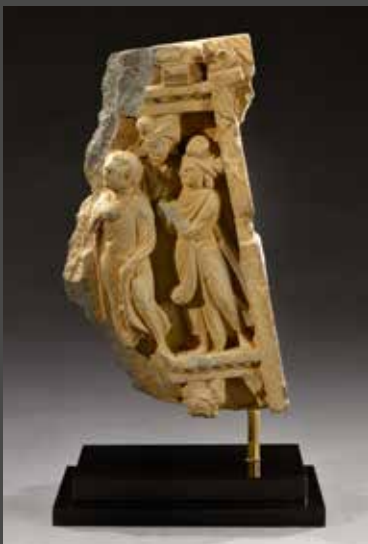
GANDHARA, II e /IV e siècle Partie de bas relief en schiste, H. 20,3 cm