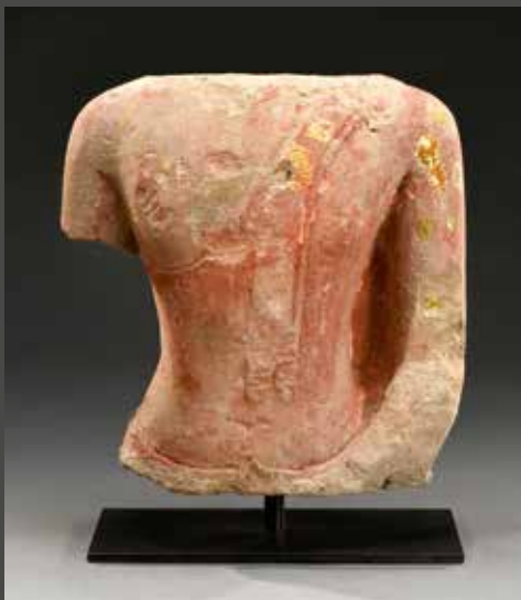
THAÏLANDE, XV e siècle Torse de bouddha en grès, H. 26 cm