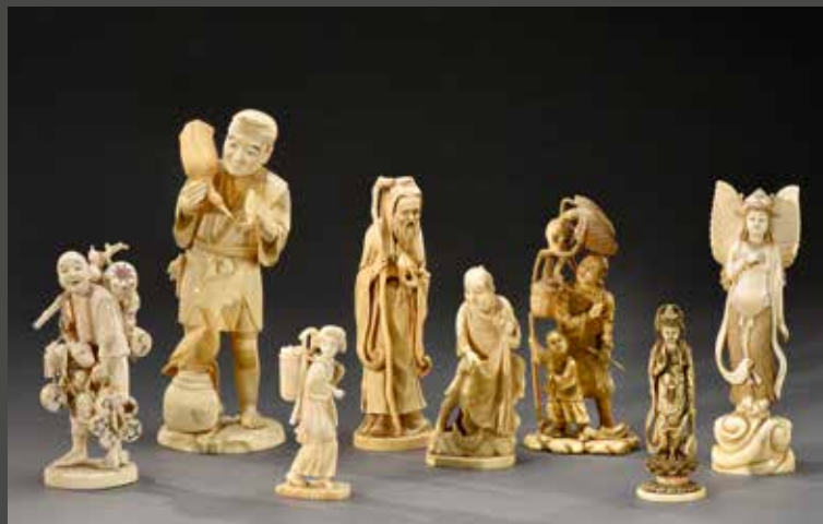
Époque MEIJI (1868 - 1912) - D'un ensemble d'okimonos