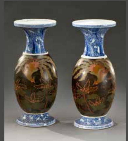
Époque MEIJI (1868 - 1912) - Paire de vases en porcelaine, H. 38,5 cm