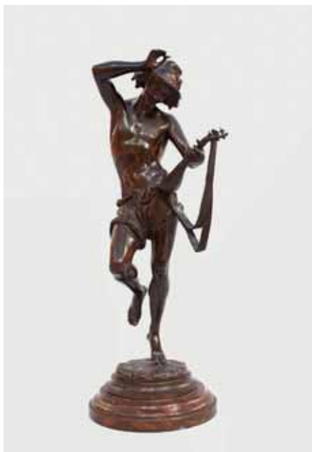
Albert-Louis CARRIER-BELLEUSE (1824-1887)

À partir du lot 270 sera dispersé un ensemble d'environ 50 lots : Objets de vitrine, Objets d'Art et d'Ameublement