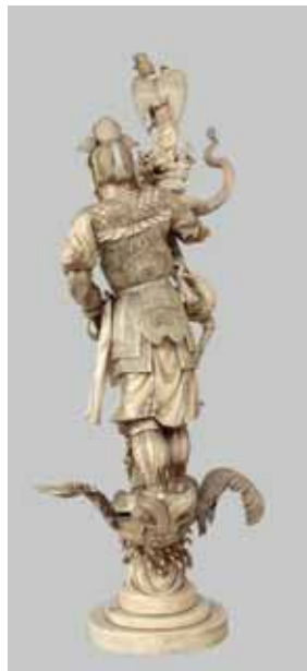
144 - Dos

Voir les reproductions et au dos de la couverture