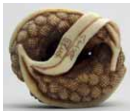
71 - Signature