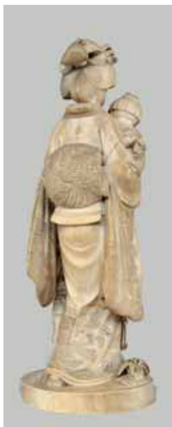
141 - Dos

Voir les reproductions et sur la couverture