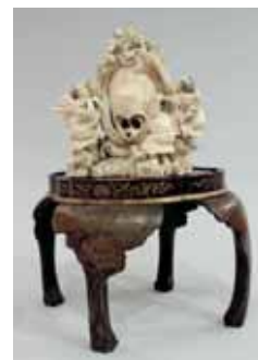
142 - Avec socle