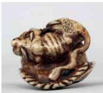
80 - Signature

80 NETSUKÉ en ivoire à patine jaune représentant un aigle ayant attrapé un chien avec ses serres, les yeux incrustés de corne brune, signé dans une réserve irrégulière.