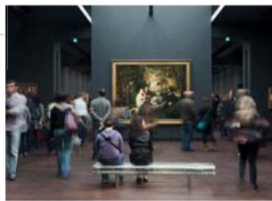
Lots n°6, n°9, n°13 et n°19

DEVENEZ DISTILLATEUR POUR UNE JOURNÉE dans l'une des distilleries les plus créatives au monde Offert par la Distillerie de Paris PRIX PUBLIC : 2 200 €