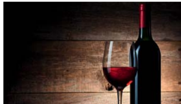
Lots n°22 et n°27

CRAVATE MAISON CADOT en soie tricotée en Italie Offert par Maison Cadot PRIX PUBLIC : 75 €