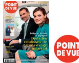
Lots n°23, n°29, n°34, n°40, et n°43