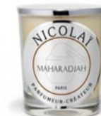
Lots n°30 et n°39

MONTRE MARCHLAB Modèle : AM59 ELECTRIC | BLACK Offert par MarchLab PRIX PUBLIC : 525 €