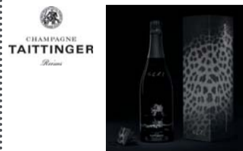
Lots n°38 et n°42

DEUX POLOS VICOMTE A. Taille M Offert par Vicomte A. PRIX PUBLIC : 138 €