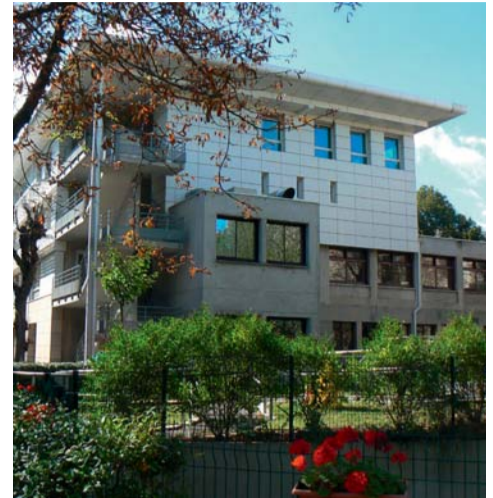
Bâtiment Notre-Dame à Neuilly-sur-Seine

Le nouveau projet auquel l'association nous propose de contribuer, en participant généreusement à la vente caritative organisée à son profit, est la rénovation du sol du jardin intérieur de l'établissement de Neuilly-sur-Seine, aujourd'hui rendu difficile d'accès, ainsi que l'aménagement du vide-sanitaire que les usagers doivent aujourd'hui contourner : ainsi, les travaux envisagés permettraient de faciliter le passage des fauteuils roulants sur l'ensemble de la cour.