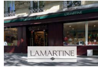
Lots n°12, n°18, n°33, n°37 et n°41

UN AN D'ABONNEMENT À LA GAZETTE DROUOT & UN LIVRE DROUOT 2016 Offert par La Gazette Drouot PRIX PUBLIC : 180 €