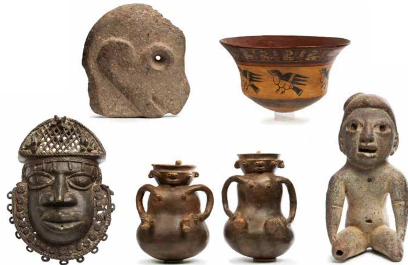
N. Hacha sculptée d'une tête de singe Maya du Guatemala, époque classique 600-900 ap. JC