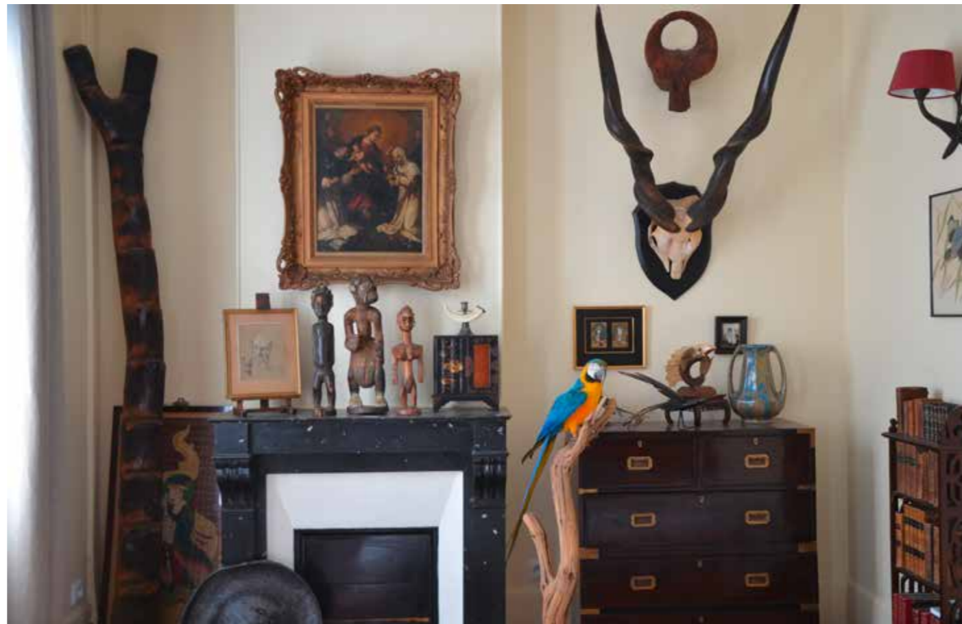
Arnaud Giovaninetti @Benjamin Decoin pour Starface