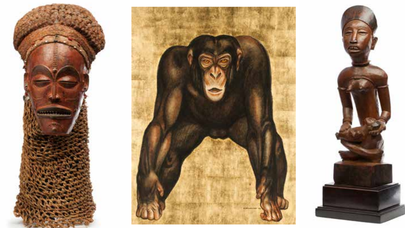
I. Tête de dignitaire Nok H : 32 cm