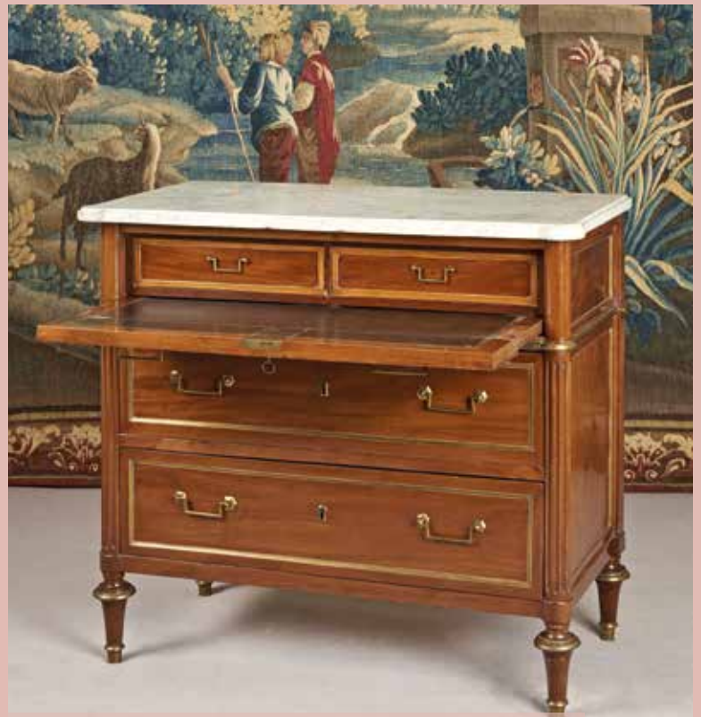
Commode en placage d'acajou, ouvrant par trois tiroirs, dont un tiroir formant écritoire. 49 x 96 x 86 cm. Epoque Louis XVI. 500/700 €