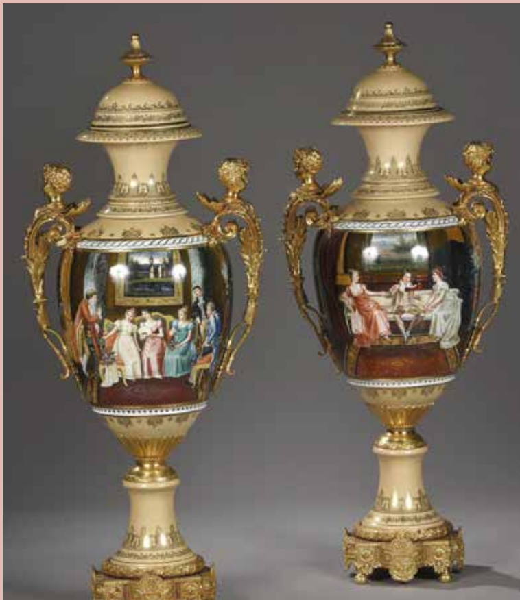
Grande paire de vases balustres en porcelaine et bronze doré. Dans le goût de Sèvres. H. 100 cm. 300/500 €