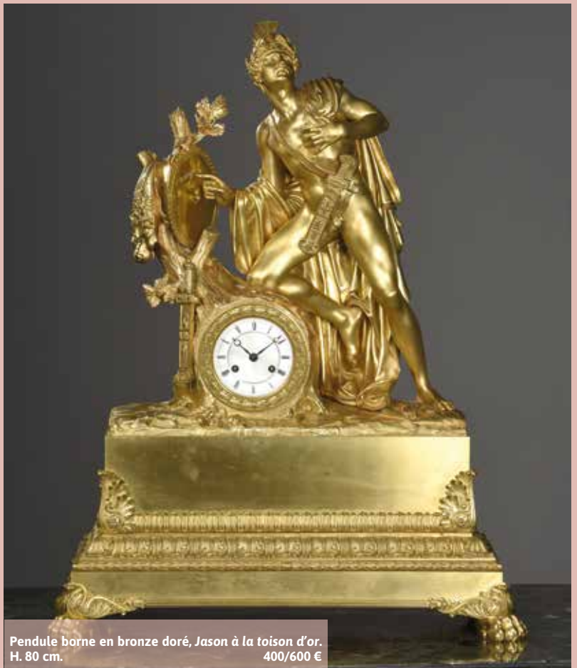
Pendule borne en bronze doré, Jason à la toison d'or. H. 80 cm. 400/600 €