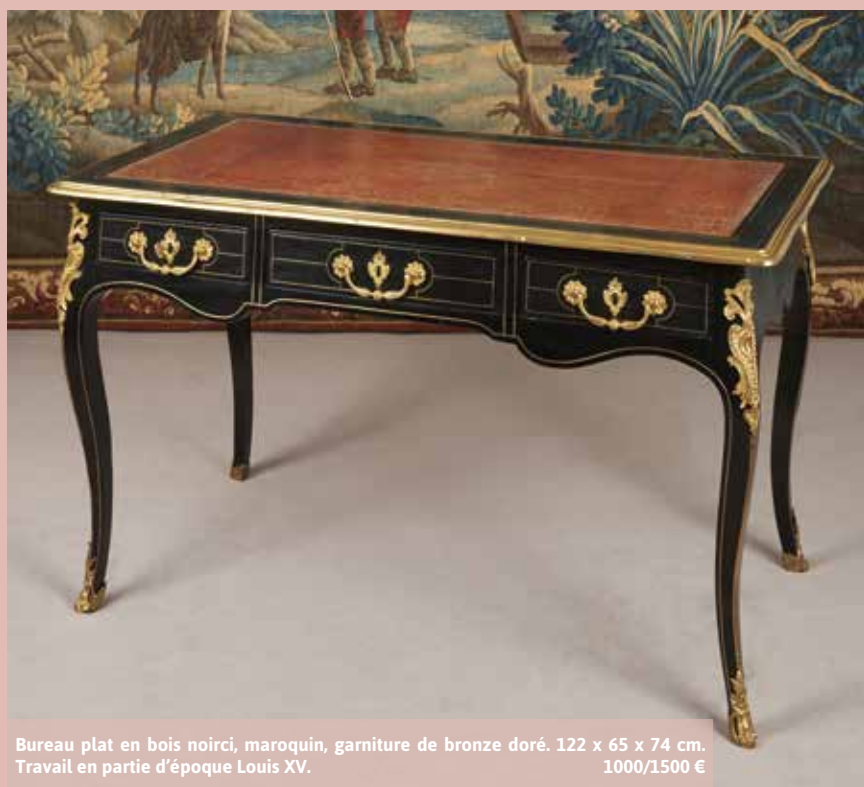
Bureau plat en bois noirci, maroquin, garniture de bronze doré. 122 x 65 x 74 cm. Travail en partie d'époque Louis XV. 1000/1500 €