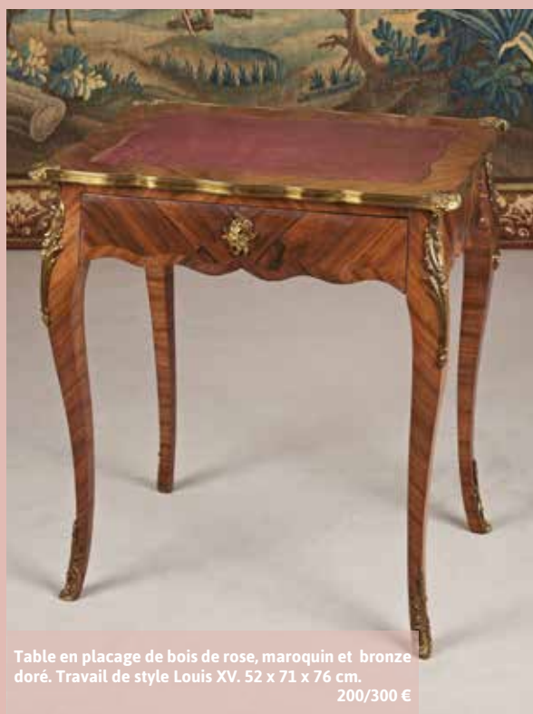
Table en placage de bois de rose, maroquin et bronze doré. Travail de style Louis XV. 52 x 71 x 76 cm. 200/300 €