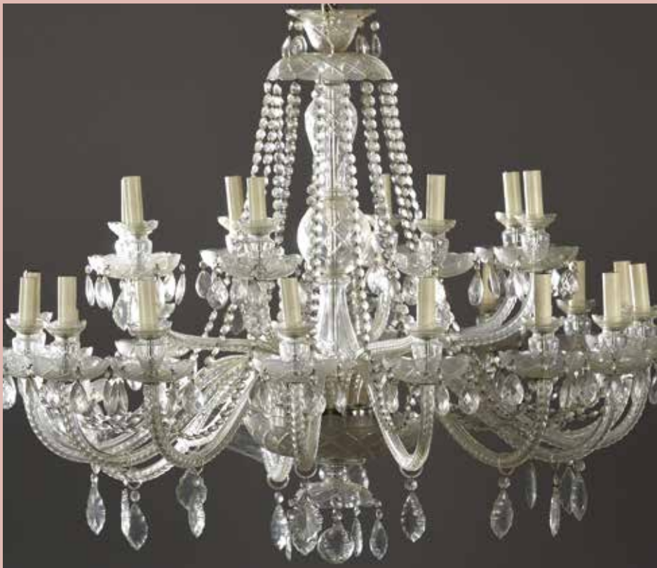
Grand lustre en verre taillé. H. 80 - L. 100 cm. On joint une paire d'appliques. H. 60 cm. 2000/2500 €