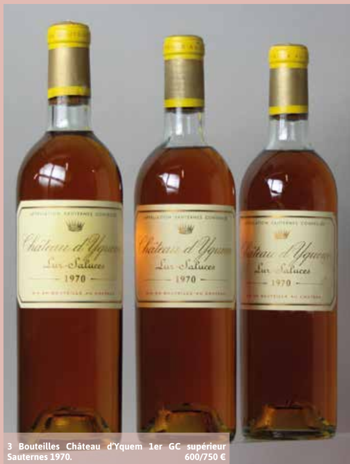
3 Bouteilles Château d'Yquem 1er GC supérieur Sauternes 1970. 600/750 €

POUR TOUT RENSEIGNEMENT CONTACTER ART VALOREM