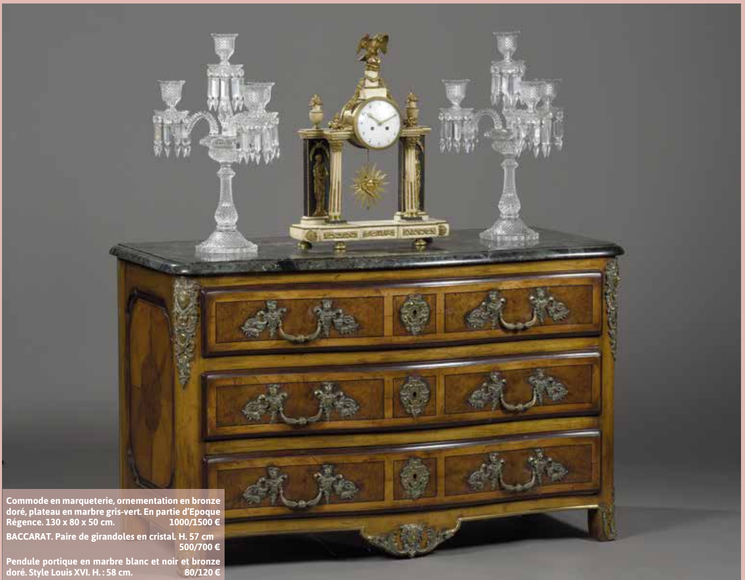
Commode en marqueterie, ornementation en bronze doré, plateau en marbre gris-vert. En partie d'Epoque Régence. 130 x 80 x 50 cm. 1000/1500 € BACCARAT. Paire de girandoles en cristal. H. 57 cm 500/700 € Pendule portique en marbre blanc et noir et bronze doré. Style Louis XVI. H. : 58 cm. 80/120 €