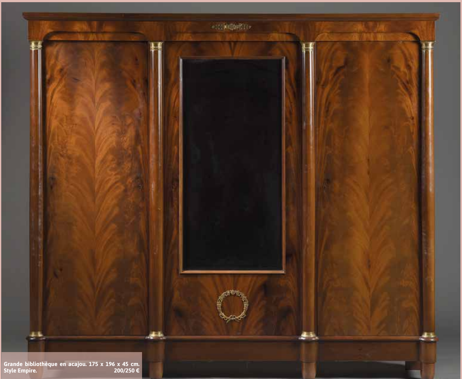
Grande bibliothèque en acajou. 175 x 196 x 45 cm. Style Empire. 200/250 €