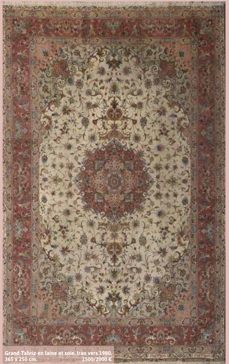
Grand Tabriz en laine et soie. Iran vers 1980. 365 x 250 cm. 1500/2000 €