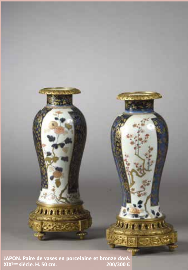
JAPON. Paire de vases en porcelaine et bronze doré. XIX ème siècle. H. 50 cm. 200/300 €