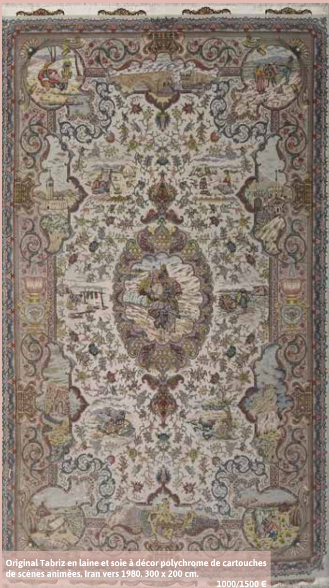
Original Tabriz en laine et soie à décor polychrome de cartouches de scènes animées. Iran vers 1980. 300 x 200 cm. 1000/1500 €