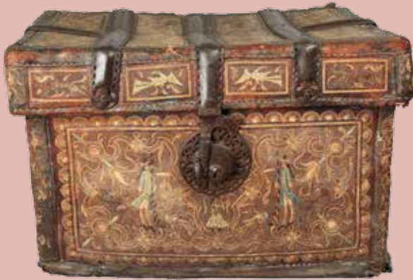
Coffre habillé de cuir et panneaux tapissés. Travail flamand, époque XVII ème siècle. 45 x 48 x 68 cm. 300/400 €