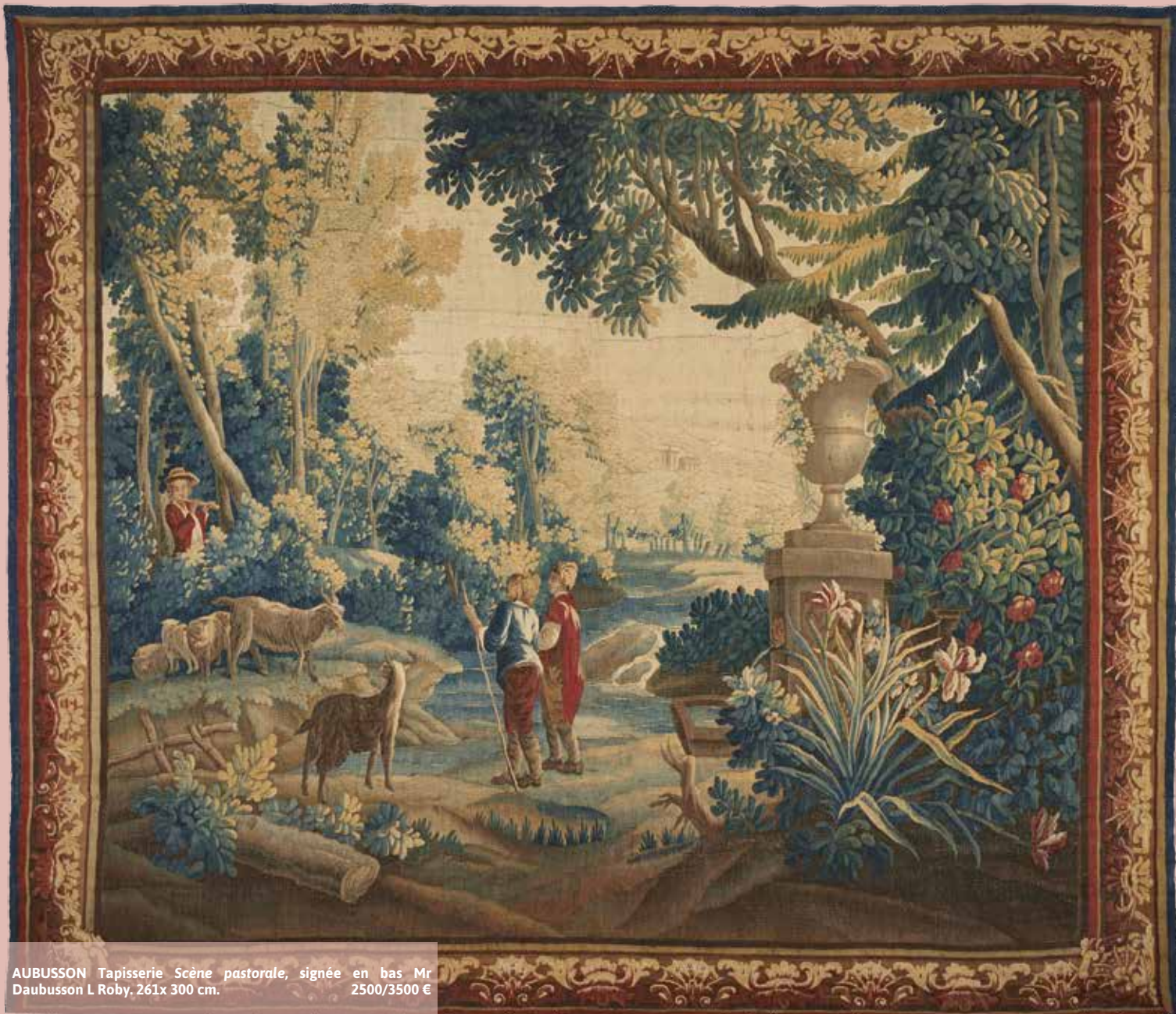
AUBUSSON Tapiserie Scène pastorale, signée en bas Mr Daubusson L Roby, 261x 300 cm. 2500/3500 €