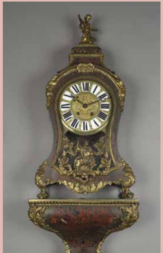
Cartel d'applique et sa console en marqueterie Boulle. Epoque Napoléon III. H. 110 cm. 400/600 €