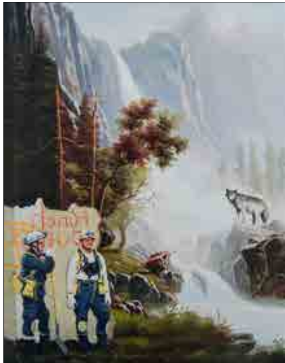
31 SHAY KUN The ruined land , 2009 Huile et acrylique sur toile H_50 cm L_60 cm 1 500 / 2 000 €