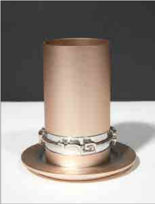
6 GOBELET DE KIDDOUCH Métal H_11 cm 300 / 500 €