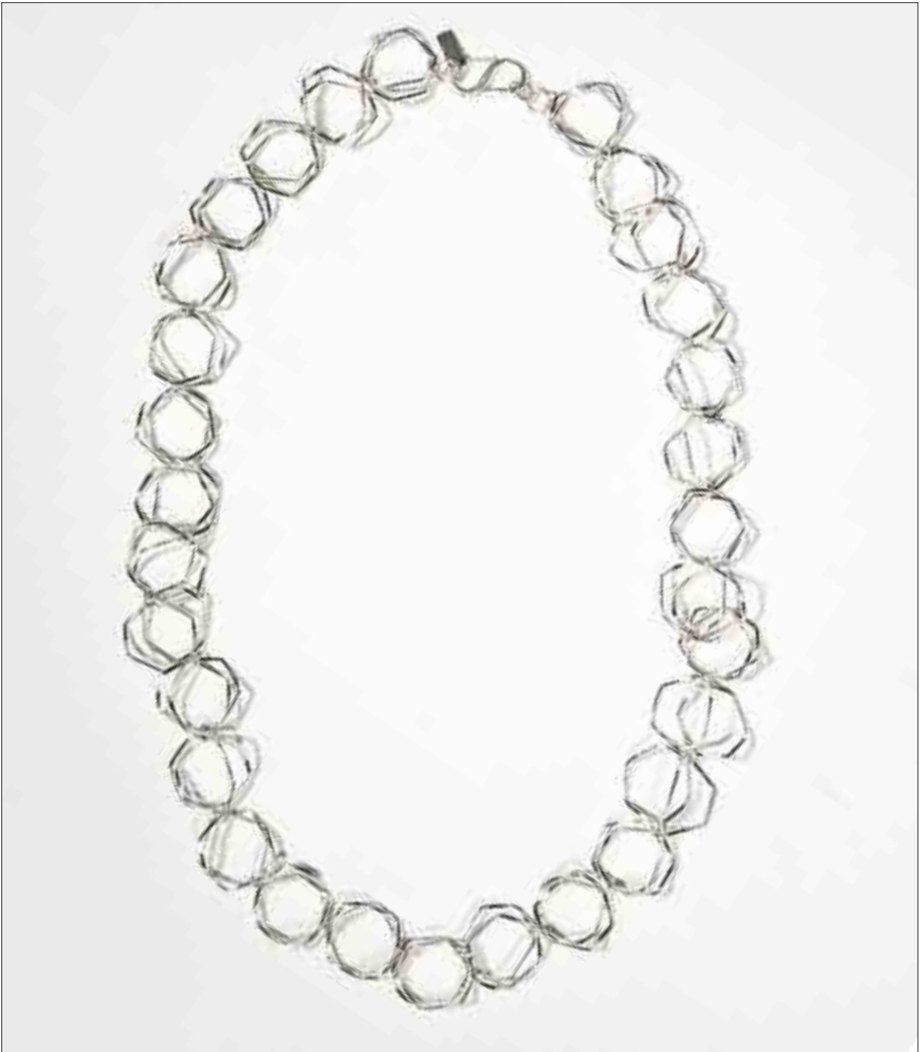
11 SARA SHAHAK Collier Argent L_42 cm 600 / 800 €