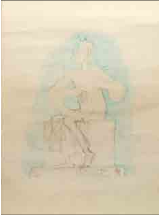
37 TIM Le roi David , 1993 Lithographie Ed. 91/260 H_50 cm L_36 cm 800 / 1 200 €