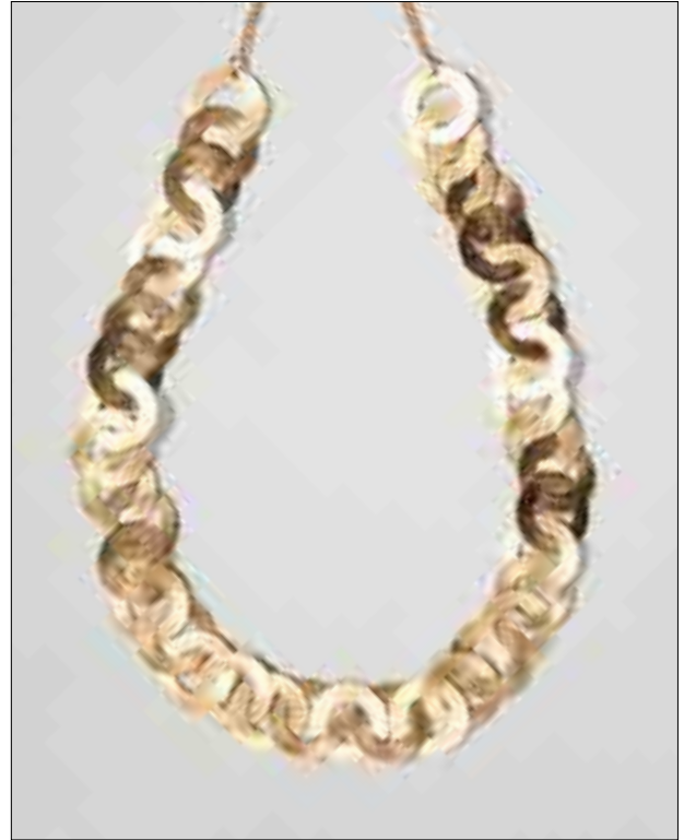
10 COLLIER DE MARIAGE Reproduction à partir des collections du Musée d'Israël Réinterprétation contemporaine d'artisanat juif tunisien Métal doré L_33 cm 300 / 500 €