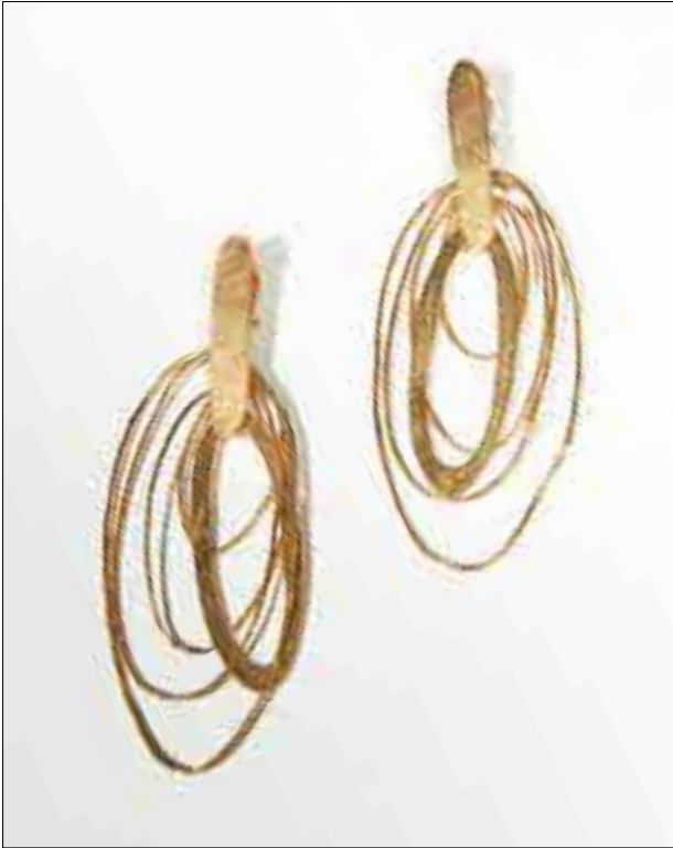
9 BOUCLES D'OREILLES CLIPS Métal doré H_9,5 cm 150 / 200 €