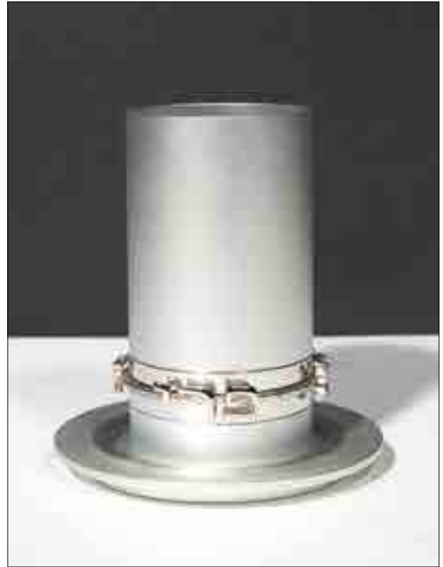
7 GOBELET DE KIDDOUCH Métal H_11 cm 300 / 500 €