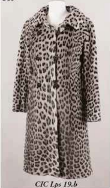
CIC Lps 19.b